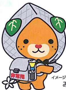
愛媛県 イメージアップキャラクター みきやん