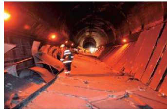
すでに警鐘は鳴らされている