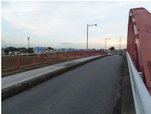
橋の高欄や照明に被害は見られない