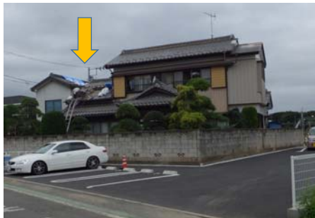
住宅の南側(被災あり)