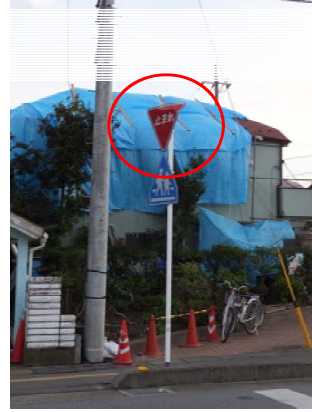
道路標識板が曲がっている