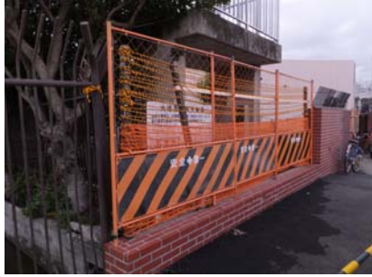
水門付近のフェンスが飛ば されている