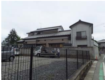
住宅の北側(被災なし)