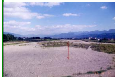
重信川本川の瀬切れ