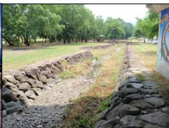
開発霞水路の瀬切れ

重信川の「瀬切れ(表面に水が流れてない状態)」は近年、区間・期間ともに拡大している状況です。瀬切れが発生すると、魚類・底生動物等の生物が生きることができません。かすみの森公園の水路も夏場には水が流れない日が多く見られ、生物が生きするにはきびしい環境です。 現在、学識・地域住民等による「開発霞ワークショップ」を行って検討を実施しており、今後計画をとりまとめ、より良い環境づくりに向けた取り組みを行っていきます。