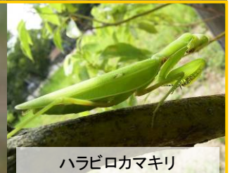
ハラビロカマキリ