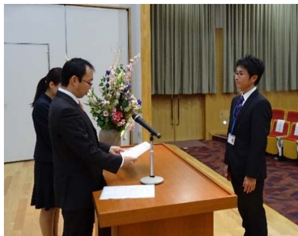
写真 2-2 履修証明書・四国ME認定証の授与