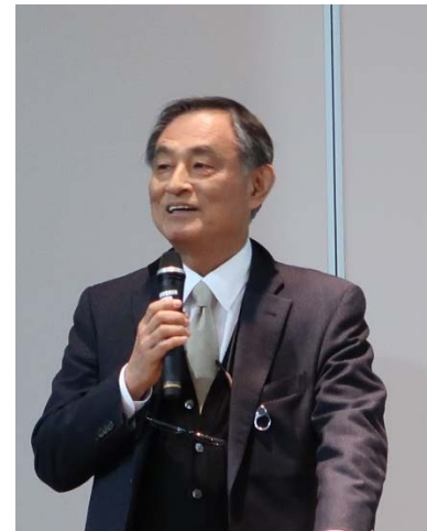
写真 1-4 特別講演（国立研究開発法人 土木研究所 理事長 西川和廣氏）