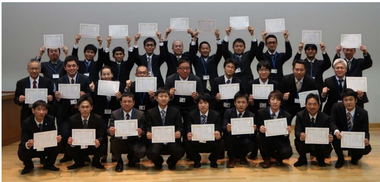
写真 2-3 授与された履修証明書を掲げる平成 29 年度四国ME認定者