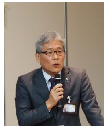
写真 1-3 講演（愛媛県 土木部長 樋口志朗氏）