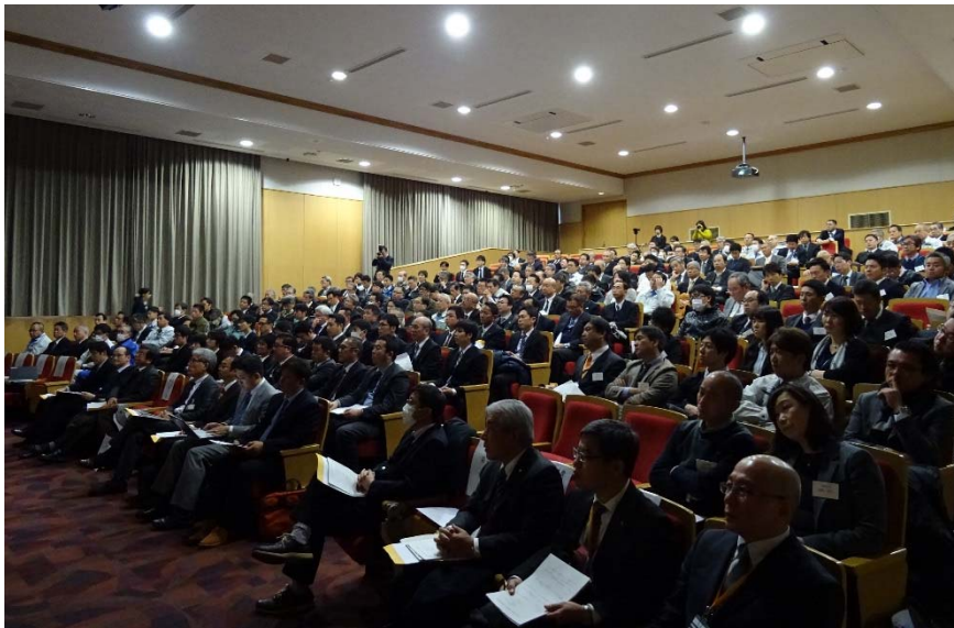
写真 1-8 会場内風景（多数の聴講者）