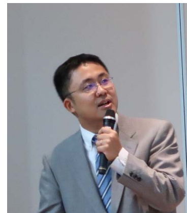
写真 1-5 報告（愛媛大学大学院 全 邦釘准教授）